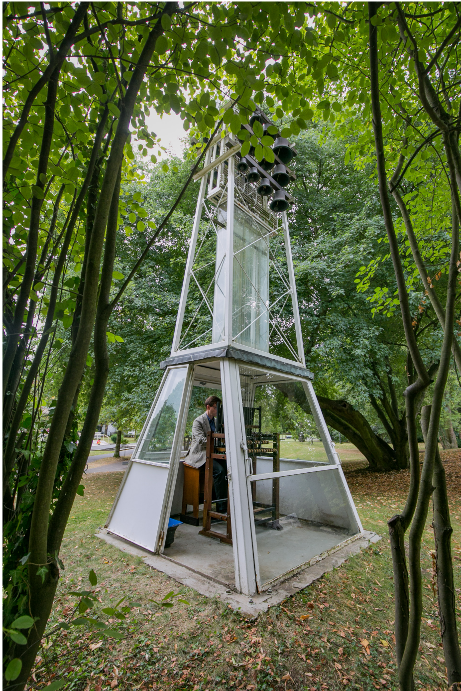
CARILLON BAD GODESBERG (GERMANY)